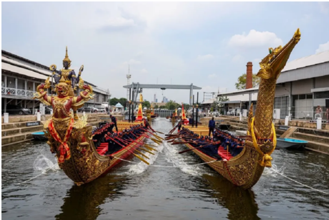
ข้อมฝ้ายเรือพระที่นั่งนารายณ์ทรงสุบรรณ รัชกาลที่ ๙ และเรือพระที่นั่งสุพรรณหงส์

‘ราชขบวนเรือพระราชพิธี’ เป็นมรดกทางวัฒนธรรมและพระราชพิธีสำคัญที่สืบทอดตั้งแต่สมัยสุโขทัย กรุงศรีอยุธยา กรุงธนบุรี และกรุงรัตนโกสินทร์ สะท้อนวิถีชีวิตคนไทยที่ผูกพันกับสายน้ำมาตั้งแต่อดีต