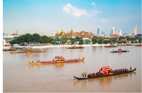
ขบวนพยุหยาตราทางชลมารค 2567

โดยในปีพ.ศ.2567 นี้ พระบาทสมเด็จพระวชิรเกล้าเจ้าอยู่หัว ทรงพระกรุณาโปรดเกล้าโปรดกระหม่อมกำหนดการ ทรงบำเพ็ญพระราชกุศลถวายผ้าพระกฐิน โดยขบวนพยุหยาตราทางชลมารค ในวันอาทิตย์ที่ 27 ตุลาคม 2567 ณ วัดอรุณราชวรารามราชวรมหาวิหาร เนื่องในโอกาสพระราชพิธีมหามงคลเฉลิมพระชนมพรรษา 6 รอบ 28 กรกฎาคม 2567