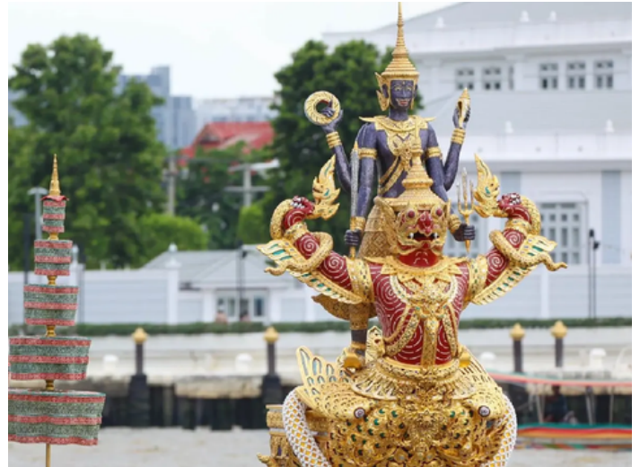
โขนเรือพระที่นั่งนารายณ์ทรงสุบรรณ รัชกาลที่ ๙

โดยโขนเรือและตัวเรือจำลองลวดลายปิดทองประดับกระจก ที่หัวเรือเบื้องใต้ครุฑเป็นช่องสำหรับปืนใหญ่ กลางลำเรือทอดบัลลังก์กัญญาและมีแท่นประทับ เรือมีความยาว 44.3 เมตร กว้าง 3.20 เมตร ลึกถึงท้องเรือ 1.10 เมตร กินน้ำลึก 40 เซนติเมตร มีฝีพาย 50 นาย