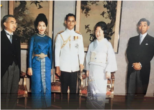
พระราชวังอิมพีเรียล กรุงโตเกียว (TOKYO IMPERIAL PALACE)

ในปี พ.ศ. 2506 ภายหลังช่วงสงครามโลกครั้งที่ 2 พระบาทสมเด็จพระปรมินทรมหาภูมิพลอดุลยเดช และสมเด็จพระนางเจ้าสิริกิติ์ พระบรมราชินีนาถ ได้เสด็จเยือนประเทศญี่ปุ่นครั้งแรกอย่างเป็นทางการ เมื่อวันที่ 27 พ.ค. - 5 มิ.ย. 2506 เพื่อการเจริญสัมพันธไมตรี อันเป็นพระราชกรณียกิจที่สำคัญยิ่ง ซึ่งสำนักพระราชวังได้ประมวลภาพพระราชกรณียกิจครั้งนี้อาไว้ ซึ่งเป็นภาพที่ใครหลายคนยังไม่เคยเห็น เราจึงขอนำมาให้ทุกท่านได้ชมกัน