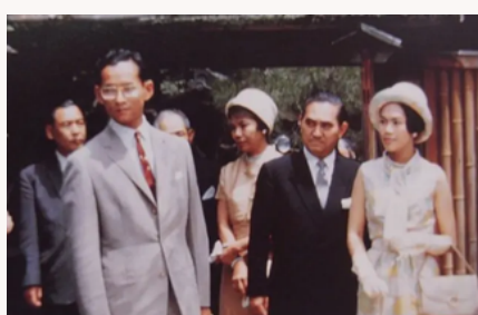
พระราชวังชูกากุอิน (SHUGAKUIN PALACE)

ทรงเสวยพระสุธารสบนตำหนักของพระราชวังชูกากุอิน (SHUGAKUIN PALACE) แปลเป็นภาษาไทยก็คล้ายกับพระราชวังไกลกังวล ซึ่งมีอุทยานสวยงามใหญ่โต ทะเลสาบกว้างขวาง มีตำหนักพักผ่อน 3 หลังสร้างมานานกว่า 300 ปี โดยพระจักรพรรดิโกเม็ซุโ