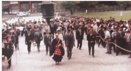
วัดโตไดจิ (TODAIJI TEMPLE)

พระบรมฉายาลักษณ์ของพระบาทสมเด็จพระปรมินทรมหาภูมิพลอดุลยเดช ขณะเสด็จพระราชดำเนินที่ทุ่งโทบิฮิโนะ (TOBIHINO HILL) ภายในสวนสาธารณะนารา (NARA PARK) และพระราชทานอาหารให้ควา