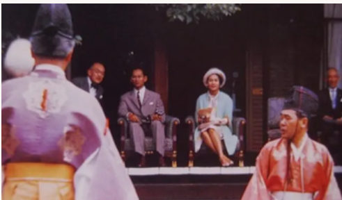
KYOTO OMIYA PALACE & SENTO IMPERIAL PALACE

ร่วมพิธีชงชาเฉพาะพระพักตร์ ซึ่งชงแบบ ยูซาซึกะ ซึ่งใช้ผงชาสีเขียว ใส่น้ำร้อน และทรงเสวยพระสุธารส อุทยานแห่งวังเซนโตะ ซึ่งเป็นเขตเชื่อมกับพระราชวังอิมิยา