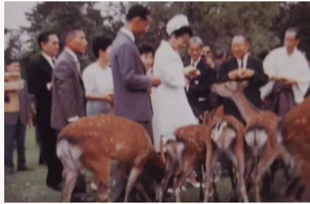
สวนสาธารณะนารา (NARA PARK)

ทรงฉายพระบรมฉายาลักษณ์ร่วมกับสมเด็จพระเจ้าจักรพรรดิฮิโรฮิโตะ และสมเด็จพระจักรพรรดินีนาถโกะ(ในขณะนั้น) ที่พระราชวังอิมพีเรียล กรุงโตเกียว ซึ่งเป็นที่ประทับของ สมเด็จพระจักรพรรดิแห่งญี่ปุ่นในปัจจุบัน ซึ่งภายในพระราชวังจะประกอบไปด้วย พระตำหนัก (宮殿 คิวเด็น) ของพระราชวงศ์ พิพิธภัณฑสถานในพระองค์, สำนักพระราชวัง, และพระราชอุทยานขนาดใหญ่ แต่เดิมพระราชวังนี้เป็นที่ตั้งของปราสาทอะโตะ ซึ่งเป็นที่อยู่อาศัยของโชกุนตระกูลโทกูงาวะ โดยได้รับการบูรณะ ปี ค.ศ. 1964 เนื่องจากพระราชวังเดิมถูกระเบิดทำลายลงไปในช่วงสงครามโลกครั้งที่ 2